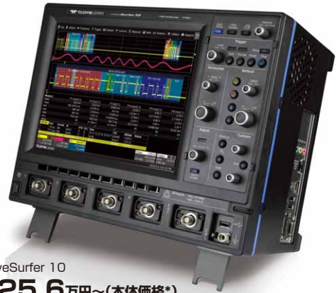
WaveSurfer 10 125.6万円 ～(本体価格*)