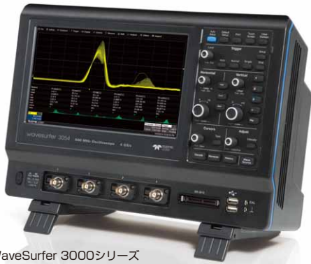
WaveSurfer 3000シリーズ 40万円 ～(本体価格*)